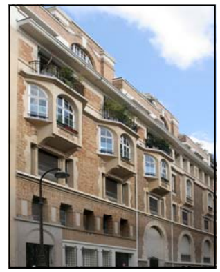
4/6 rue Albéric Magnard, Paris