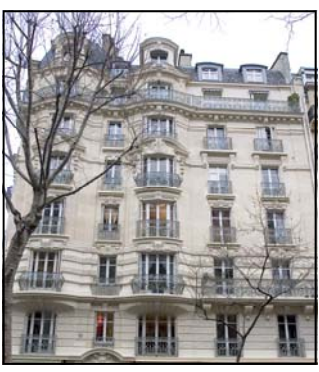
104 avenue Ledru Rollin, Paris XII