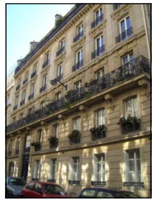
9 rue de la Bienfaisance, Paris VIII